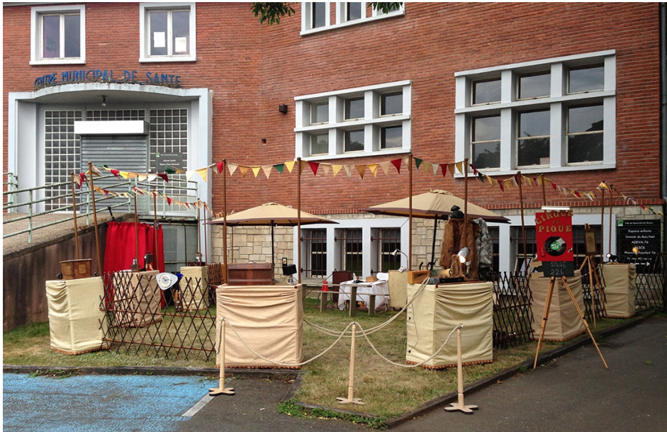
La scénographie est à ciel ouvert, des parasols abritant les spectateurs du soleil.