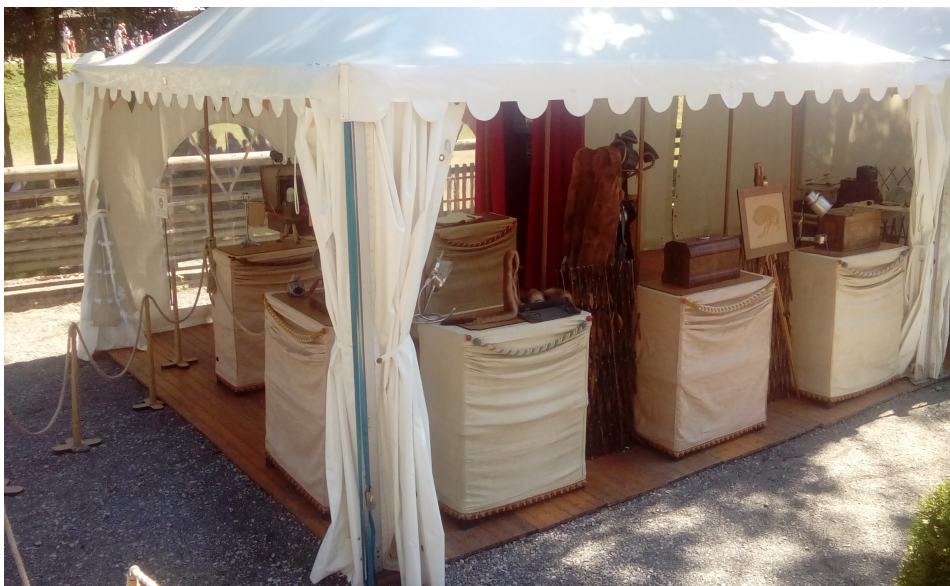
Possibilité de jeu sous tente de réception format 5x10 m, ou sous tente berbère ( Tente fournie et installée par l'organisateur )