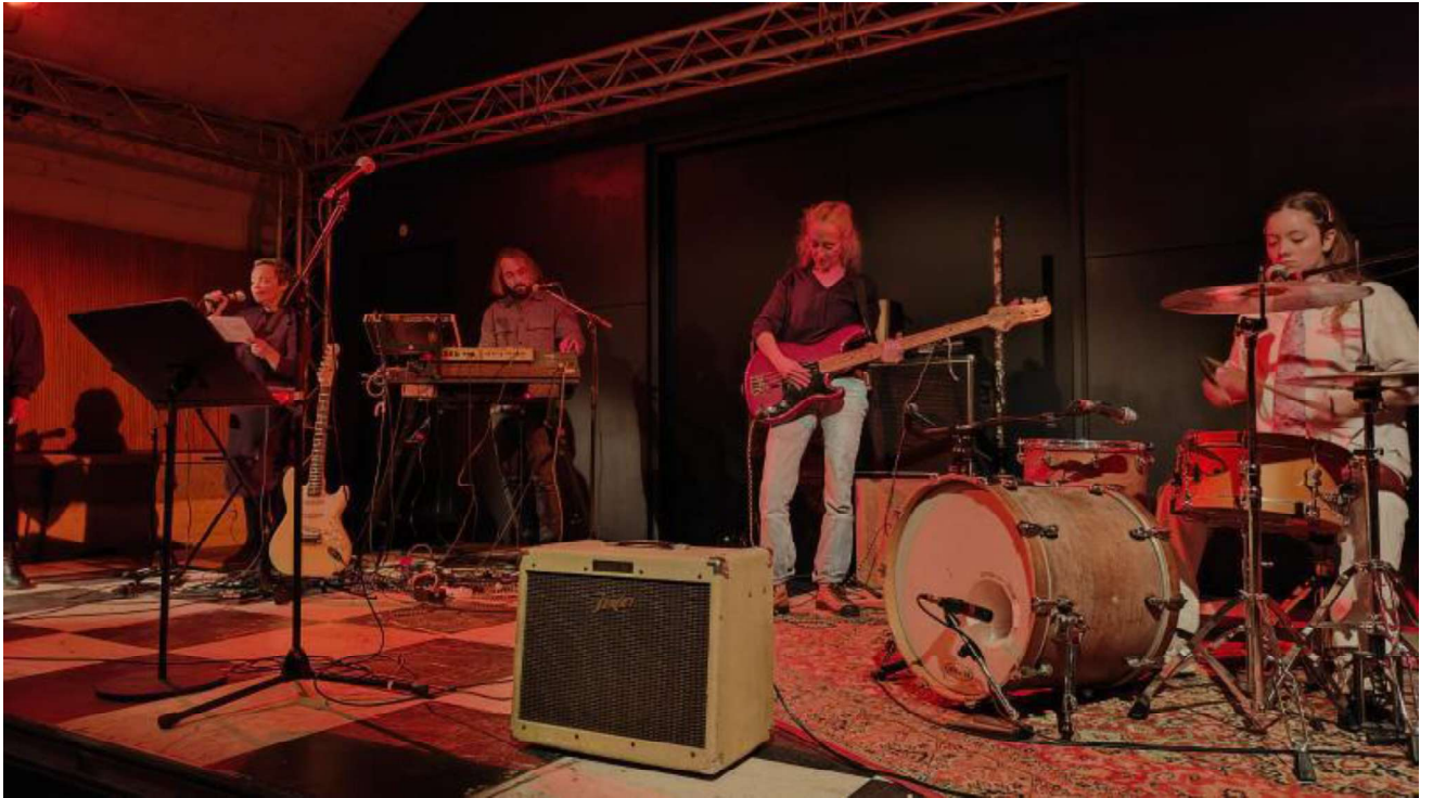
Vives, crash test, 16 novembre à l'Ogre, 2024